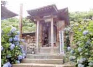
前田慶次供養塔 堂森善光寺 (米沢市)