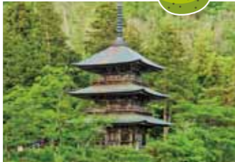
安久津八幡神社 (高畠町)