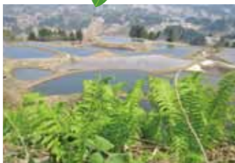
山古志の棚田・棚池