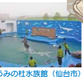
仙台うみの杜水族館 (仙台市)